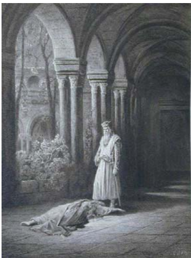
Fuente: Guinevere , by Alfred Tennyson, illustrated by Gustave Doré (London: Edward Moxon and Co., 1877).

Teniendo en cuenta este entramado que Cunqueiro diseña entre los hechos reales y de ficción, la amplia y compleja gama de referencias folclóricas -Avalon, Carmarthen, profecías, el Santo Grial, un cuervo, Jerusalén, la venganza, Geoffrey de Monmouth, Tintagel, o Sir Gawain, entre otros... –, no es fácil discernir en ocasiones el origen de la referencia o su pertenencia a un sistema literario y cultural concreto. Uno de esos elementos es la figura del mago Merlín, esencial en la carrera literaria del autor gallego (recordemos la importancia de obras como Merlín e familia o El año del cometa en la prosa gallega contemporánea).