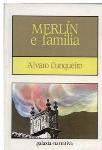
Portada actual de Merlín e familia una de las obras más reeditadas de la historia de la editorial Galaxia.

Álvaro Cunqueiro (1911-1981) es uno de los principales escritores de la literatura gallega del siglo XX, con obras publicadas tanto en gallego como castellano. Sin embargo, todavía hay muy pocos que reconocen su labor como periodista. Vinculado al periodismo la mayoría de su vida profesional, fue director de Era Azul y Faro de Vigo , ejerciendo tareas directivas en Vértice y Vida Gallega , trabajando como redactor en Faro de Vigo , y colaborando casi a diario en numerosos periódicos y revistas durante cincuenta años. De toda esta actividad, hoy en día sus artículos sobreviven como prueba de su calidad profesional. Cunqueiro podría ser considerado como uno de los periodistas más representativos de España del siglo XX. Sus habilidades como escritor, así como su conocimiento etnográfico de una gran variedad de culturas son esenciales a fin de justificar la declaración anterior. Su amplio conocimiento de las diferentes culturas - principalmente periféricas - y este caso las culturas de los países de habla inglesa, serán el objetivo principal de este trabajo. De hecho, en los dos artículos siguientes que hemos seleccionado, el mayor porcentaje de referencias pertenece a la matière du Bretagne , datos que serían imposibles de descifrar sin un conocimiento previo de las culturas periféricas, su historia y su literatura.