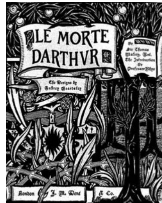
Fuente: The Birth Life and Acts of King Arthur. Illustrations by Aubrey Beardsley (London: J.M. Dent, 1893-1894).

representaciones clásicas de las leyendas del rey Arturo, tal y como se conoce en la actualidad.