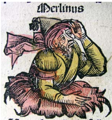
Grabado de "Merlinus" del Nuremberg Chronicle (1493).

tradicón folclórica de las islas que conforman el Reino Unido. Robert de Boron desarrollará todo el universo ficcional en torno a Camelot, que a su vez desplazará a Merlín a un segundo plano. Es en este momento que Boron se centrará principalmente en la figura del rey Arturo, en Camelot, Ginebra, Lanzarote, y la búsqueda del Santo vaso.... De hecho, el Grial y todos los símbolos relacionados con la búsqueda de este elemento mítico representarán el punto de unión en las diferentes narraciones, reinos y personajes en la obra de Boron. A estas alturas, de la figura de Merlín desaparecerán los rasgos que le identificaban con el profeta Vortigern y se produce su cristianización. Del mismo modo, la perspectiva cristiana en las narraciones de Boron constituye un cambio que afecta a todos sus personajes, en especial, al personaje de Merlín, quien perderá todos sus poderes de origen maligno y pasarán a ser explicados desde un trasfondo de origen divino.